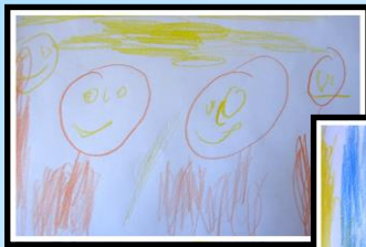
„ Linksmi draugai “