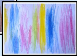
„ Fontanas “