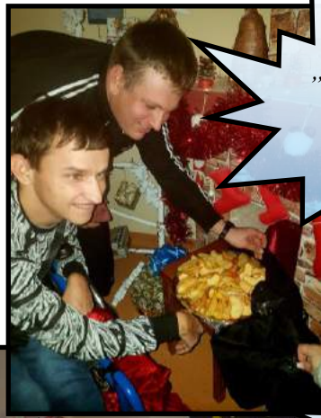
„Stebuklingų obuolių vakarėlis.“ (Kastytis)