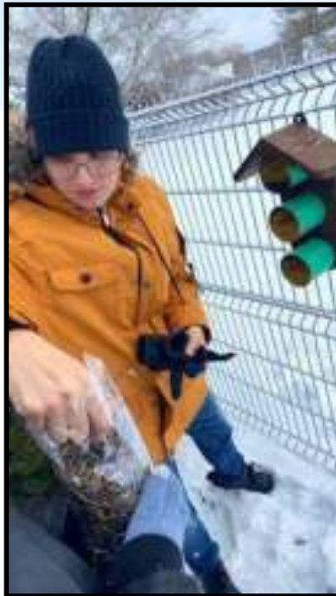
Dienos centro bendruomenė