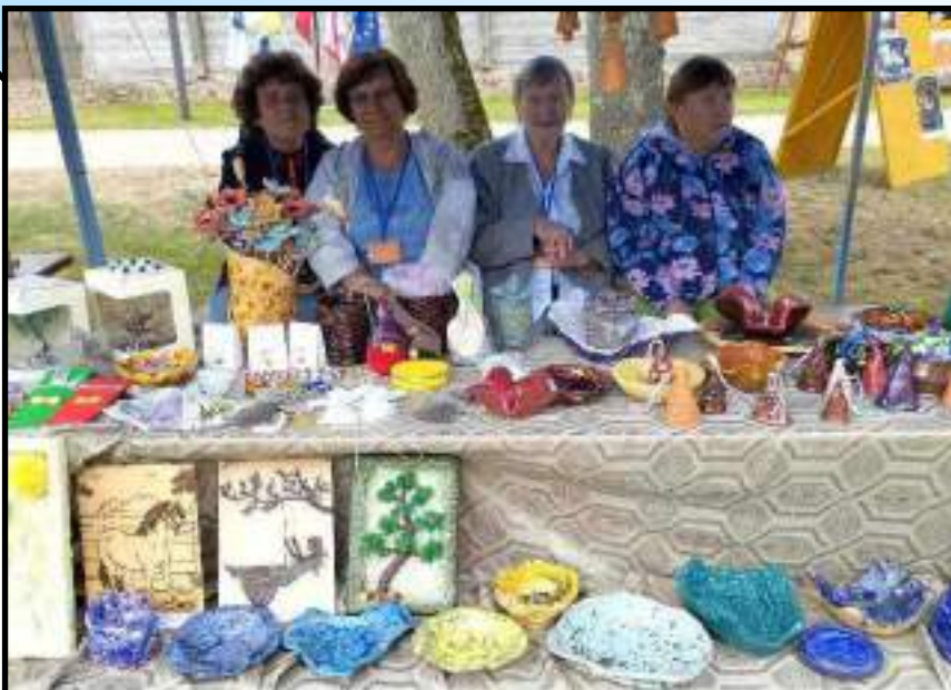
Įstaigos bendruomenės nariai

Liepos 22 dieną Įstaigos bendruomenės nariai dalyvavo XXIII teatrų festivalyje-konkurse „KARTU“ Kurtuvėnuose. Festivalio svečiai turėjo galimybę įsigyti įvairių lankytojų dirbinių, pagamintų iš molio (lėkštės, žvakidės, vazelės, dubenėliai ir t.t.), tekstilės, medžio (paveikslai, skirtukai), karoliukų (apyrankės, angeliukai, pakabukai, medeliai ir t.t.) ir plastilino. Didžiausio susidomėjimo sulaukė įvairūs molio dirbiniai. Džiaugiamės galėję būti didelio ir gražaus festivalio dalimi.